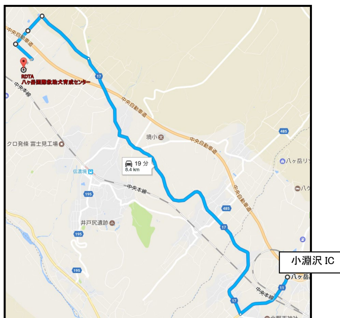
※中央道 小淵沢 IC より